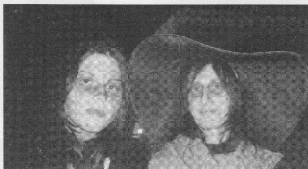
Le due "Befane".

N.B. Ricordiamo a tutti che nella Bachecca di Piazza Matteotti, (a fianco l'esedra), potrete trovare spesso Notizie Utili.